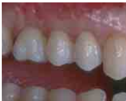
Abbildung 4: Zirkon-Kronen

Implantate werden vom Organismus in der Regel als körperfremd erkannt. Durch moderne Forschung ist es zwar gelungen Materialien zu entwickeln oder zu verwenden, die möglichst schwache Immunreaktionen nach sich ziehen, aber ganz unterdrücken kann man das nicht einmal mit Materialien wie Titan.