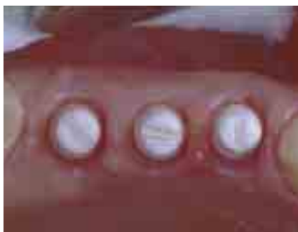
Abbildung 3: Zirkon-Implantate

Dazu wurden die Implantate in ihrer sterilen Verpackung mit den Schwingungen folgender Einträge informiert: Arnica D4, Symphytum D3, Knochencompacta D2, Harmonische Regulation LM 50. Abgesehen davon läuft alle 4 Stunden für 10 sec. im Dauerprogramm ein von der Diode mit weissem Rauschen ermitteltes Programm mit folgenden Einträgen: